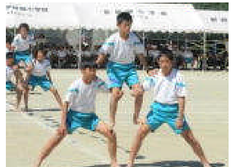
5・6年 「THE KUMITATE2013」