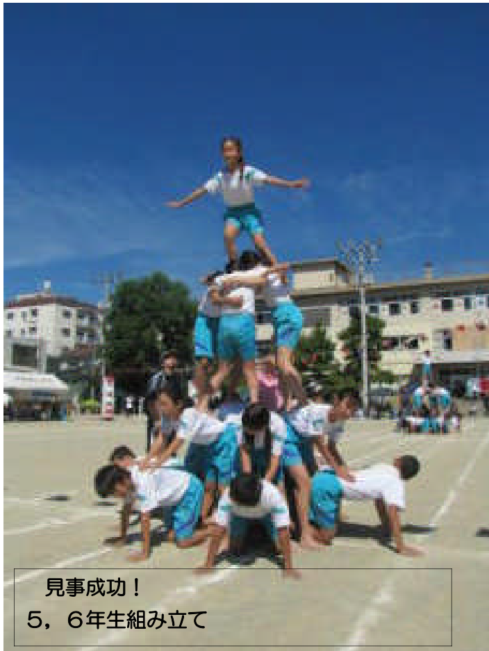
見事成功! 5, 6年生組み立て

「みんなで協力! 笑顔輝く運動会」をテーマに、取り組んだ運動会。心配していた暑さも、気合いで乗り切り元気に練習できました。当日も、思いの外、好天に恵まれ、子どもたちも演技、競争、自分の役割など精一杯頑張りました。保護者の皆様には、前日準備、当日の片付けと、手際よくご協力頂き、本当にありがとうございました。この運動会を通して、協力する大切さや協力の仕方、思いを込めて取り組むことなどを学んでくれたことと思います。