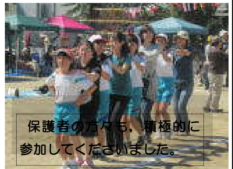
保護者の方々も、積極的に 参加してくださいました。