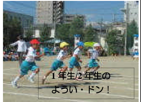
1年生/2年生の ようい・ドン!

「みんなで協力! 笑顔輝く運動会」をテーマに、取り組んだ運動会。心配していた暑さも、気合いで乗り切り元気に練習できました。当日も、思いの外、好天に恵まれ、子どもたちも演技、競争、自分の役割など精一杯頑張りました。保護者の皆様には、前日準備、当日の片付けと、手際よくご協力頂き、本当にありがとうございました。この運動会を通して、協力する大切さや協力の仕方、思いを込めて取り組むことなどを学んでくれたことと思います。