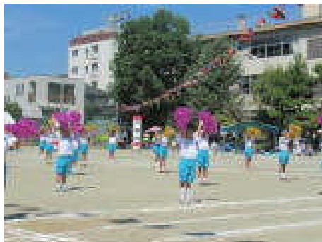
1・2年 「にんじゃり ぱんぱん」